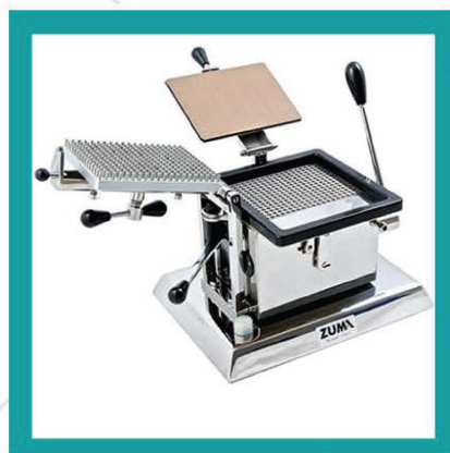
OPERCOLATRICE SEMIAUTOMATICA ZUMA OSZ/300K