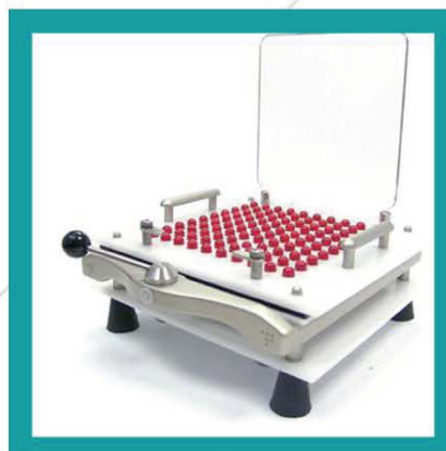
INCAPSULATRICE MANUALE ZUMA OMC/100