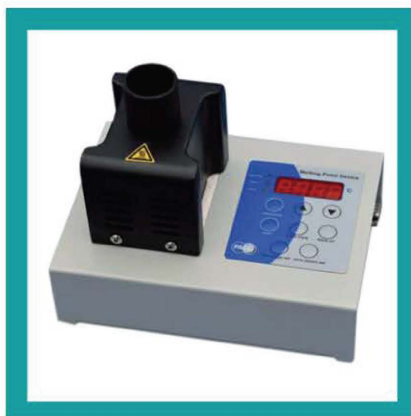
PUNTO DI FUSIONE RAFFREDDATO