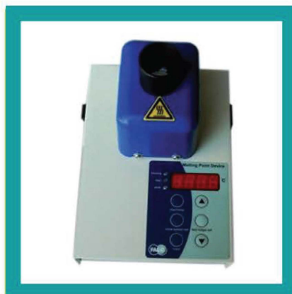
PUNTO DI FUSIONE