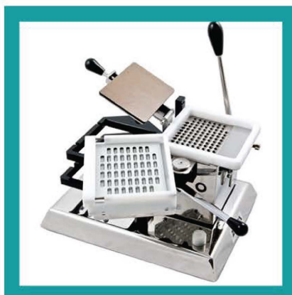
OPERCALCOLATRICE SEMIAUTOMATICA ZUMA OSZ/100C