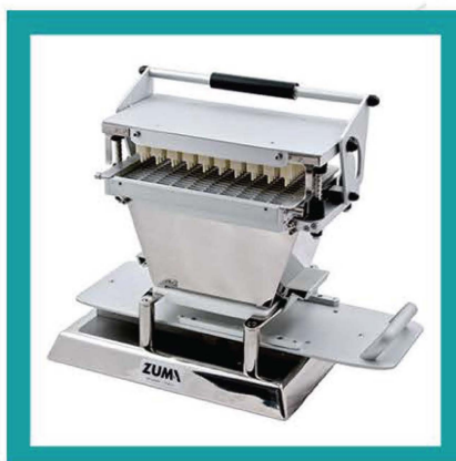
CARICATORE SEMIAUTOMATICO ZUMA CSZ/300Y