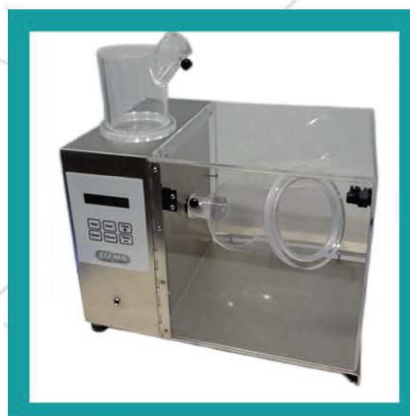
MESCOLATORE AUTOMATICO ZUMA MAZ/1500D