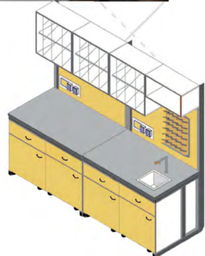
240x83x90 - 200h