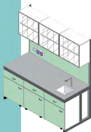
180x83x90 - 200h