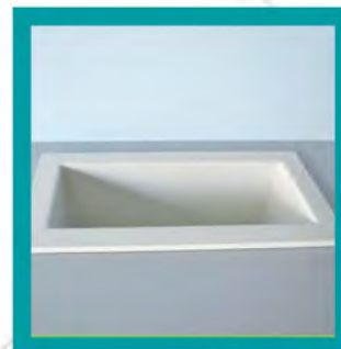
Vasca in Polipropilene