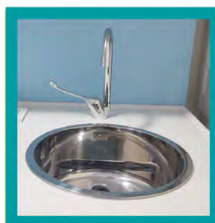
Vasca in Acciaio