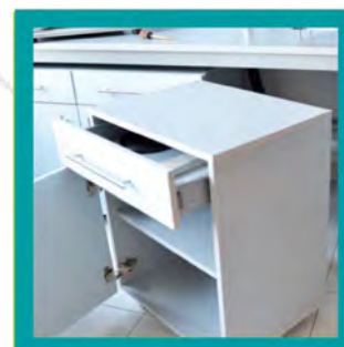
Mobiletti estraibili su ruote